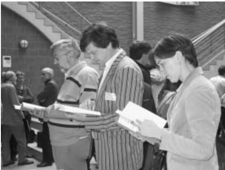
Enkele deelnemers aan Focus 2004 raadplegen de nieuwste editie van de Vlabidoc .