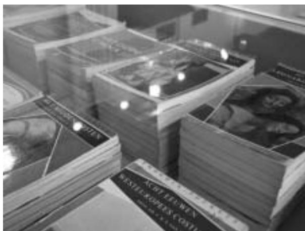
Boeken om naar te kijken OKBV-activiteit 21 juni - 15 juli 2004

Het bestuur is verheugd te constateren dat die activiteiten die als doel hebben deelnemers uit verschillende sectoren te rekruteren zoals de studiereis naar Denemarken en het najaarsevenement 'Focus op collecties & bestanden', daar duidelijk in geslaagd zijn.