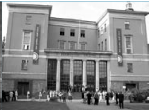
IFLA Conferentie te Oslo van 13 tot en met 19 augustus 2005