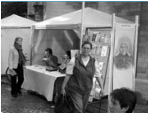
CultuurMarkt Antwerpen op 28 augustus 2005