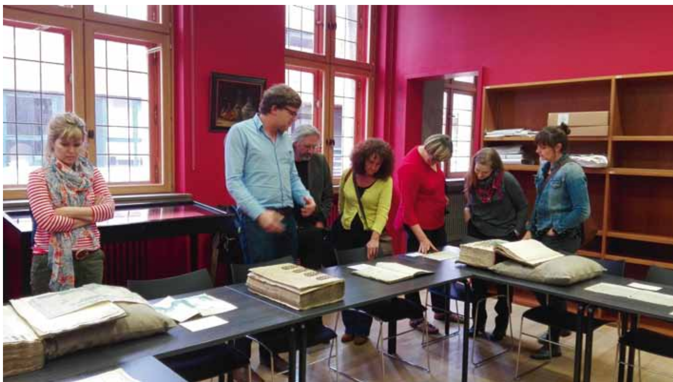
OKBV bezocht in Kortrijk de unieke archief- en bibliotheekcollecties die beheerd worden door de Stichting de Bethune en het Kortrijkse Rijksarchief. 17 juni 2016.

Data van de vergaderingen: 29 februari, 2 juni, 29 november. Er waren gemiddeld 8 van de 10 leden aanwezig op de vergadering, aangevuld met gemiddeld 2 plaatsvervangers.