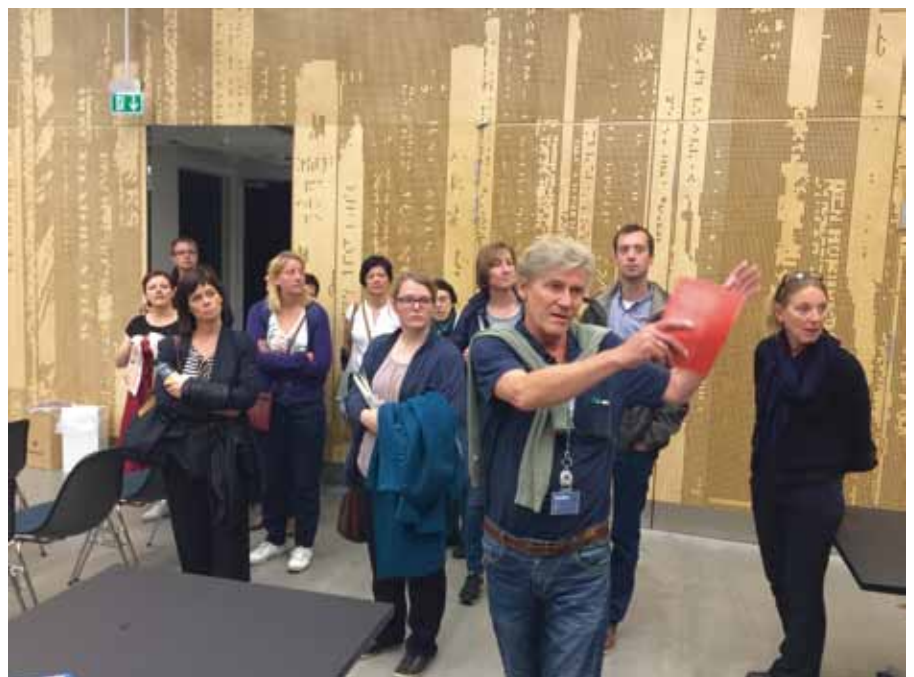
Deelnemers aan de intersectorale studiereis naar Denemarken. 15-18 juni 2016.

Kabinet en Vlaamse Regering beslisten om de overheveling van de persoonsgebonden provinciale bevoegdheden naar gemeentelijk of Vlaams niveau uit te stellen tot 1 januari 2018. De voorbereidingen van deze overdracht gingen in 2016 echter onverminderd door, met o.a. impact op de Provinciale Bibliotheeksystemen (over te