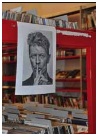
Foto cover: De openbare bibliotheek Antwerpen, tijdens de kennismakingsdag VVBAD-APBD op 15 februari 2016.