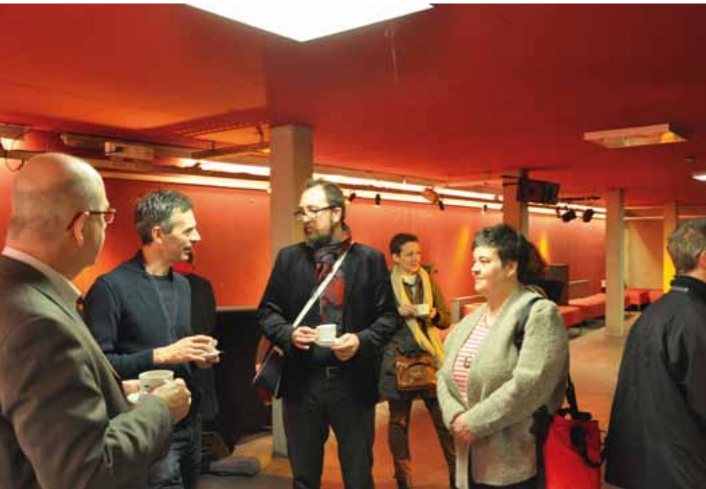
Kennismakingsdag VVBAD-APBD over de taalgrens heen. OB Antwerpen, 15 februari 2016.

22 maart was een dag die in het geheugen gegrift staat omwille van de aanslagen in Zaventem en Brussel. Het nieuws sijpelde langzaam door en was de hele dag onderwerp van gesprek. Aan het begin van de plenaire sessie namen de aanwezigen een minuut stilte in acht als erbetoon aan de slachtoffers.