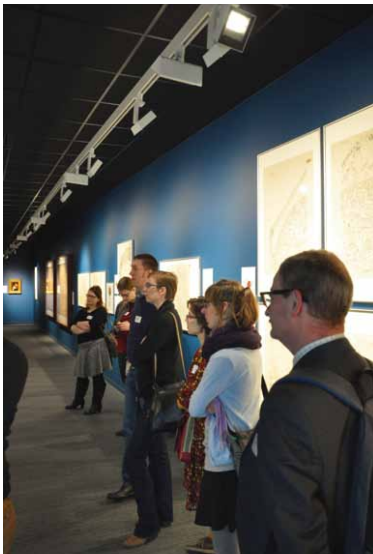
Rondleiding door het Mercatormuseum tijdens de algemene ledenvergadering te Sint-Niklaas. 22 maart 2016.

In 2021 bestaat de VVBAD 100 jaar . We startten nog niet met concrete voorbereidingen om onze verjaardag te vieren, maar in 2017 worden daarvoor ongetwijfeld de eerste stappen gezet.