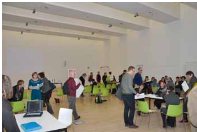
Brainstormen tijdens het namiddag gedeelte van Focus op het imago .