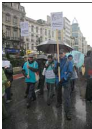
De Hart boven hart manifestatie op 29 maart 2015.