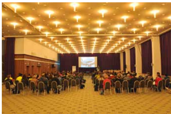
Een voordracht op Informatie aan Zee .