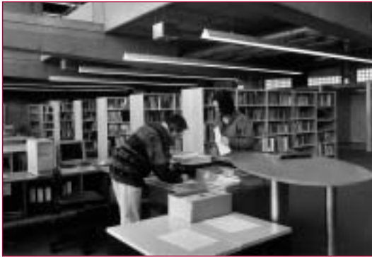
Katholieke Hogeschool Mechelen